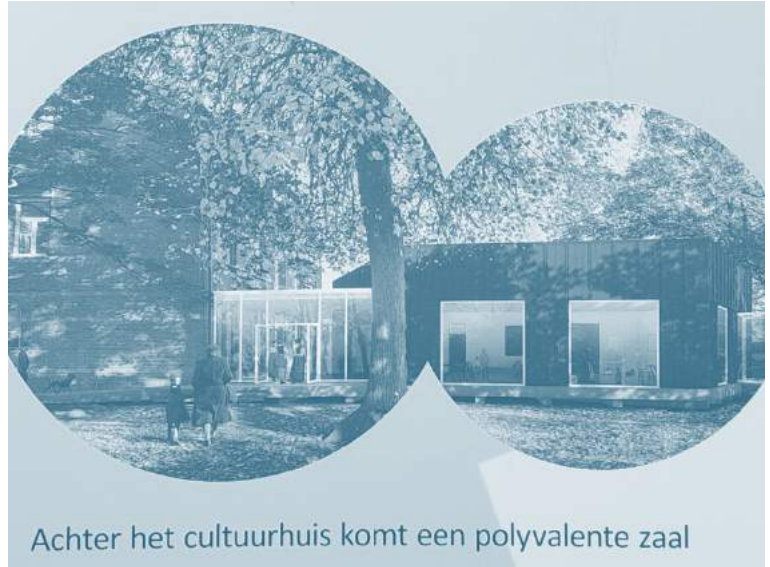
Achter het cultuurhuis komt een polyvalente zaal